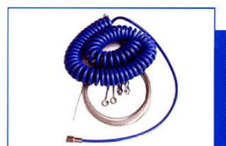
62.325.00 H-SD Slangats