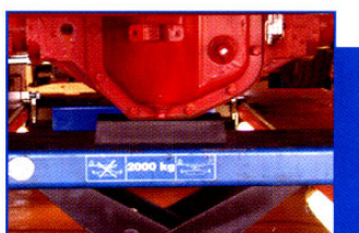
47-012 Gummikloss 40 mm 47-013 Gummikloss 70 mm